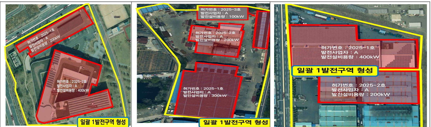
(예시1) 1구내 주차장 & 건물 → 1발전구역 (예시2) 1구내 1동 & 2동 & 3동 → 1발전구역 (예시3) 소유자 동일 인접 2건물(2구내) → 1발전구역

* 구내 건물 소유주가 명목상 상이하더라도 실질적 소유주체가 1인으로 판단 되는 경우 1구내를 일괄 1발전구역으로 판단할 수 있으며, 전기사용장소가 확정된 경우라도 발전계약 신청 시점을 기준으로 발전구역은 상이하게 판단 가능